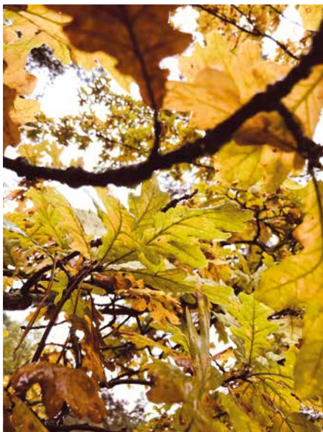
Karolina Nowak, grupa młodsza, miejsce 2.