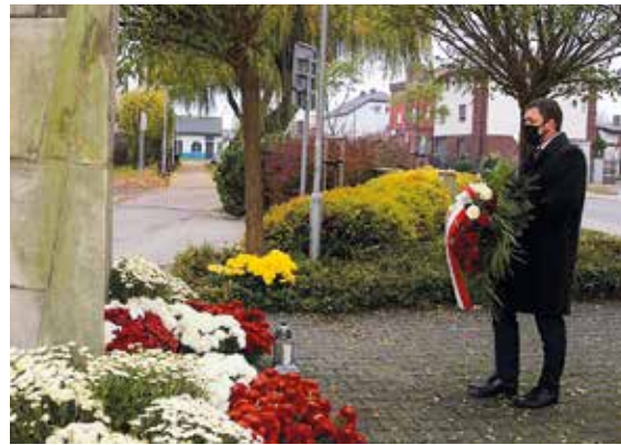
W imieniu samorządu hołd bohaterom złożył wójt gminy Gierałtowice Leszek Żogała.