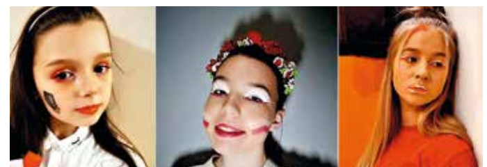
A tak, w pomysłowy sposób, Święto Niepodległości uczcili w domowym zaciszu uczestnicy Warsztatów Charakteryzacji prowadzonych w świetlicy GOK w Przyszwicach.