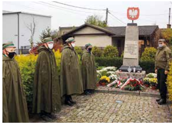
Przed pomnikiem w Przyszwicach honorowej asysty udzielili harcerze.