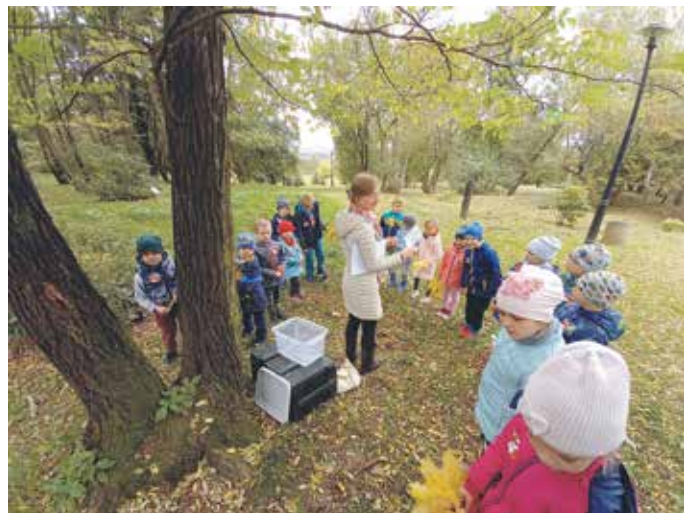
„Mali odkrywcy” z przedszkola w Gierałtowicach na wycieczce edukacyjnej w Śląskim Ogrodzie Botanicznym w Mikołowie.