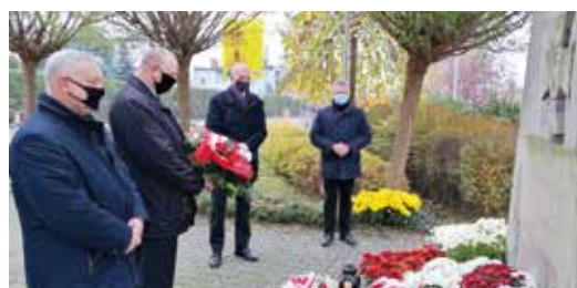
Przed pomnikiem hołd złożyli również radni powiatu gliwickiego