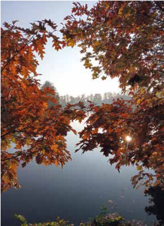
Grażyna Kus, dorośli, miejsce 1.