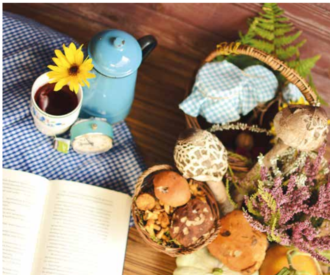
Liwia Kłonica, grupa młodsza, miejsce 3.