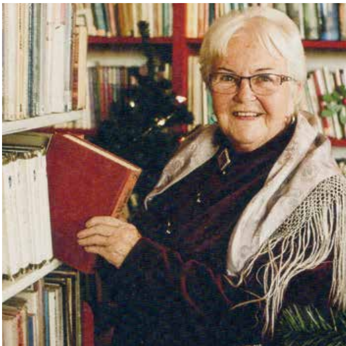
Foto: Monika Burszczyan [w:] Szota-Eksner Katarzyna: Her Story. Herstorie silnych kobiet. Srocza Góra 2020