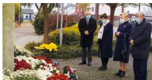
Jak zawsze o bohaterskich przodkach pamiętali społecznicy z miejscowych stowarzyszeń i organizacji.