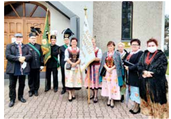
Podniosły charakter nabożeństwa w Paniówkach podkreślał udział pocztów sztandarowych.