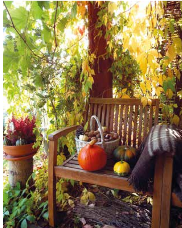
Aneta Palusinska, dorośli, miejsce 2.