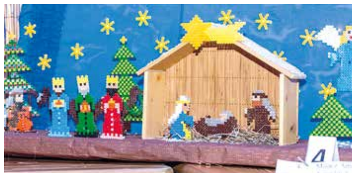
Zwycięska praca z ubiegłego roku w kategorii dla dzieci.