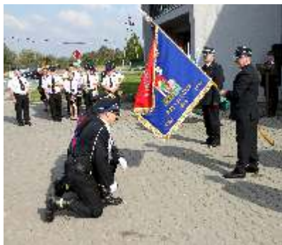
Sztandar ufundowany w ubiegłym roku towarzyszy strażakom podczas ważnych wydarzeń i uroczystości.

Druhowie z Przyszowic zdają sobie sprawę, że ich umiejętności są niezwykle ważne podczas akcji ratowniczych,