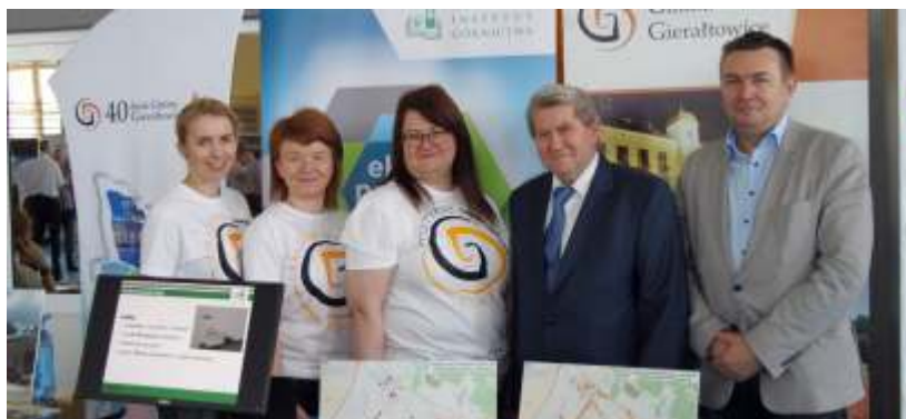
Wśród wystawców nie zabrakło Gminy Gierałtowiec - samorządowe stoisko wzbudzało spore zainteresowanie gości targów.

Interesująco prezentowało się stoisko naszej gminy, zorganizowane wspólnymi siłami przez Referat Ochrony Środowiska oraz Zespół Zarządzania Kryzysowego. Promowano na nim m.in. ostatnie działania gminy związane z pomiarami czystości powietrza. Zaprezentowano mapę rozkładu zanieczyszczeń na terenie wszystkich miej-