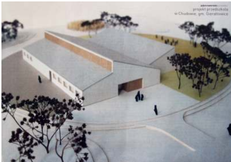
Wizualizacja przedszkola w Chudowie, autorstwa pracowni Jojko+Nawrocki Architekci s.c.

Budynek będzie miał powierzchnię 1011 m 2 i kubaturę 5349 m 3 . W przestrzeni tej będą funkcjonowały cztery oddziały przedszkolne. Obiekt można tak rozbudować, by zmieścił się również piąty oddział.