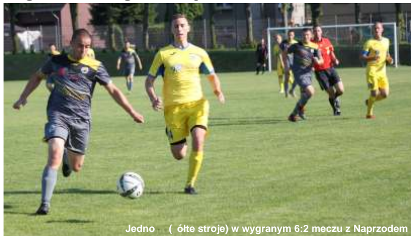
Jedno ci (ciemne stroje) w wygranym 6:2 meczu z Naprzodem

Tylko trzy mecze pozostały Jedno ci Przyszowice do zakończenia sezonu 2017-2018. Znakomicie spisując się w tym roku drużyna po 27. kolejkach zgromadziła 58 punktów i jedną nogę jest na podium tabeli, mając równo punktów i zwycięstw z Orłem Mokre. Dodać jednak należy, że 23 maja, w ramach zaległej 17. kolejki, piłkarze z Przyszowic ulegli rywalom z Mokrego 0:3. Już trzy dni później, w 27. kolejce, Jedno ci wróciła na właściwe tory i pomimo bezbarwnego początku meczu, ograła pewnie 6:2 solidny zespół Naprzodu Rydułtowy.