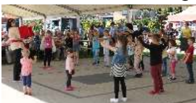
Kung Fu Panda - program przygotowany przez Agencję Artystyczną Coral, zapewnił najmłodszym dobrą zabawę.

Dla najmłodszych gości festynu przygotowano program rozrywkowy Kung Fu Panda. Dzieci miały okazję poszaleć w wesołym miasteczku, a także skorzystać z przejażdżki konnej na wierzchowcach z Orodka Terapeutycznego Kapiry.