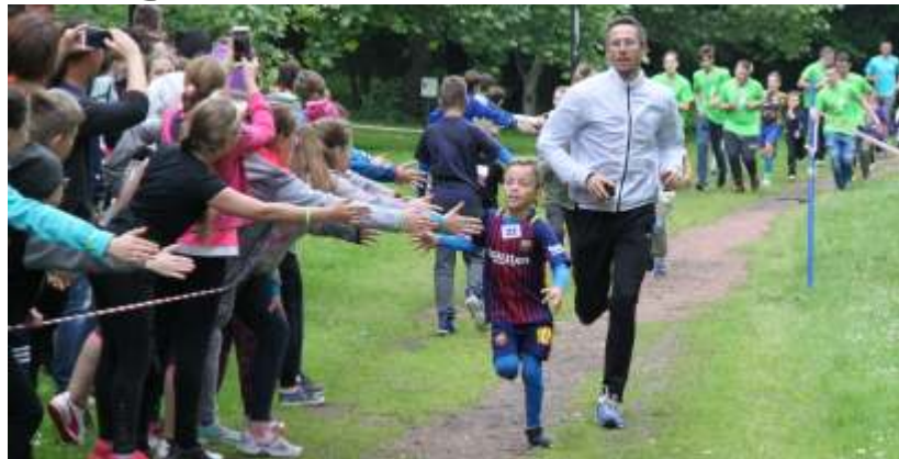
Radość z biegania czerpali zarówno kibice jak i uczestnicy biegu. Po niej role się odwracały, to kibice ruszali na trasę i „przybijali piłkę” z tymi, których wcześniej dopingowali.

Uczestnicy biegów w Przyszowicach zawsze mogą liczyć na nagrody, a to za sprawą losowania upominków, w którym bierze udział wszyscy biegacze. - W tym roku na nagrody dostaliśmy od sponsorów 6,5 tys. zł. Dziękujemy im za ich wsparcie i gratulujemy organizatorom!