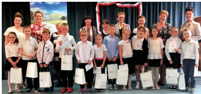
Asy z trzeciej klasy w towarzystwie opiekunów i organizatorów konkursu.