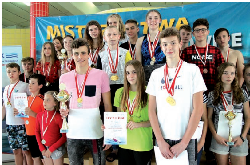
Mistrzostwa pokazały, że w naszej gminie nie brak młodych i utalentowanych pływaków.

wa (4:55,89), na czwartym z Gierałtowiec (5:06,53).