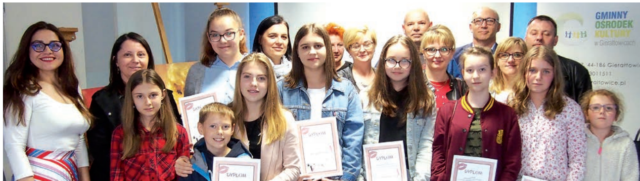
Charakteryzacja to prawdziwa sztuka – nie mieli wątpliwości organizatorzy i uczestniczki warsztatów

Trzydzieści ciekawych tematów „przerobiły” uczestniczki cotygodniowych warsztatów charakteryzacji.