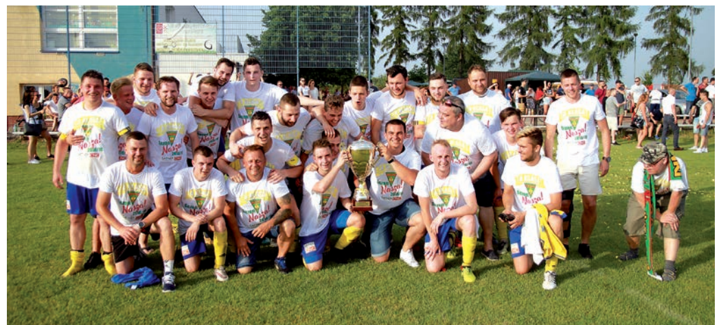
Mistrzowie klasy B