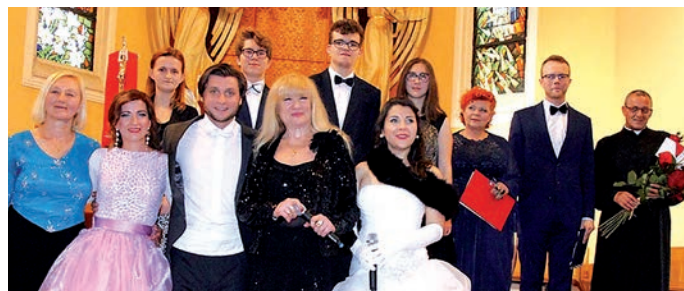
Artyści i organizatorzy zebrali zasłużone słowa uznania i brawa.