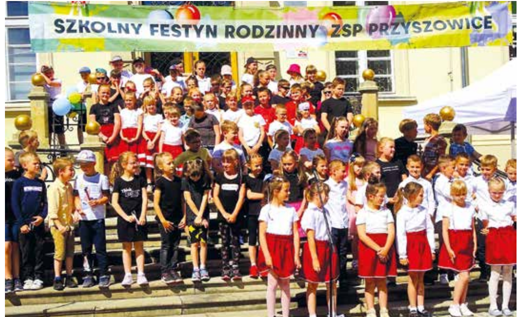
Zdolni i utalentowani – takich uczniów w przyszwickiej szkole nie brakuje...