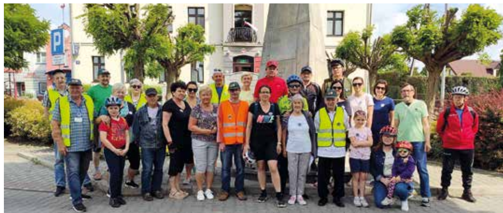
Latami uświęconą tradycją rajd rozpoczął się przed budynkiem Urzędu Gminy; fot. archiwum KA Stokrotka.

– Tam, jak zawsze, smakowali pyszne kołoczki, specjalnie pieczone na rajd przez Cukiernię „Czech” – podzielili się wrażeniami na swoim facebookowym profilu.