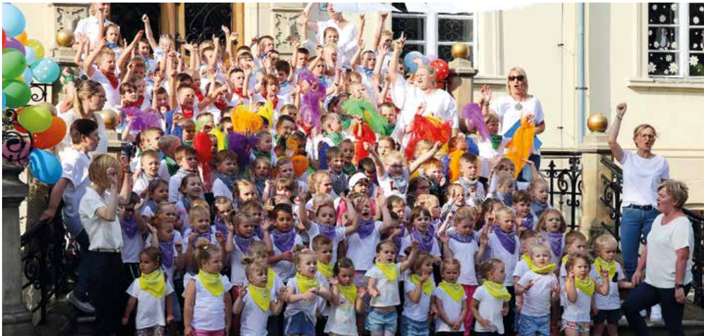
Jak zabawa, to zabawa – przedszkolaki świetnie się w nią wczuli...