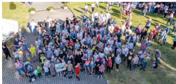
Uczestnicy pikniku nie odmówili sobie iście rodzinnej fotki z lotu ptaka; fot. Krzysztof Krzemiński.

Planom sprzyjała pogoda i program artystyczny z przedszkolakami w roli głównej. Milusińscy zapewnili swoim mamom, tatom, babciom, dziadkom i rodzeństwu mnóstwo wspaniałych doznań, występując układach choreograficznych opracowa-