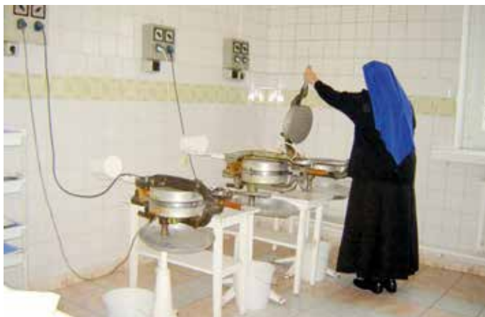
W piekarni: wypiek dużych krążków, z których później na specjalnej maszynie wykrawano małe, czyli hostie.

Zgromadzenie sióstr św. Jadwigi z siedzibą w Katowicach – Bogucicach otworzyło swoją placówkę w Przyszowicach w 1936 r. Jak wyglądały początki ich pobytu w Przyszowicach, niech opowiedzą one same. Oddajmy im więc głos – oto obszerne fragmenty z kroniki klasztoru, która została spisana już po wojnie.