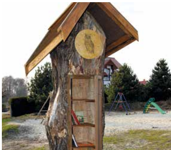
Punktem czytelniczym w Parku Joanny patronuje wizerunek sowy – symbolu mądrości, ale też książek i bibliotek.