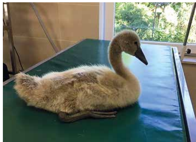
Tacy pacjenci też się trafiają...