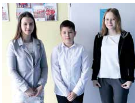
Uczniowie z Gierałtowiec.