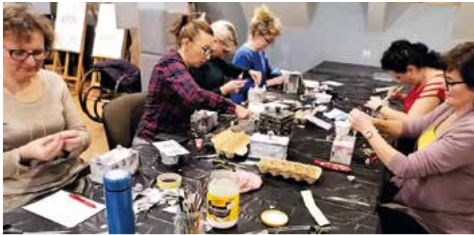
Przyszowickie warsztaty szybko zyskały grono wiernych uczestniczek.

Krótką zachętą wystarczyła. Odzew był spory, szybko skrzyknęła się grupa chcących oddać się twórczej pasji. Spo-