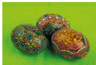
Nagrodzone kroszonki Joanny Urbanik.