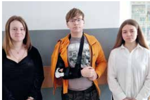
Laureaci i finaliści z Chudowa.