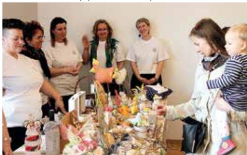
Naprawdę było w czym wybierać...