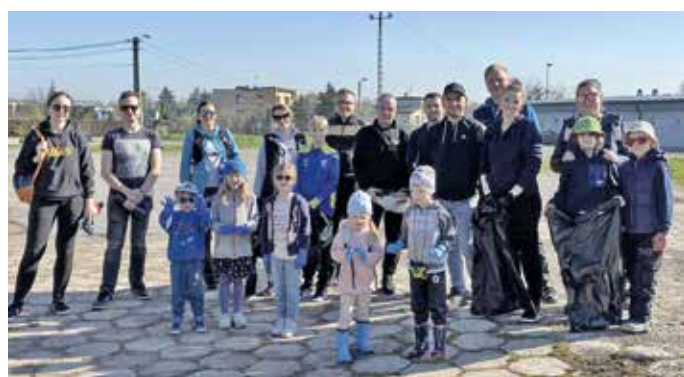
W Przyszowicach akcja miała też dodatkową wartość: integrowała pokolenia...

– Odwiedzili ulice: Targową, Paderewskiego, Kopernika, Ogrodową, Powstańców Śląskich, Zgrzebniocka i Sienkiewicza – poinformowała Rada Sołectwa Gierałtowiec. – Grupa sprzątających nie była zbyt liczna, ale bardzo zorganizowana