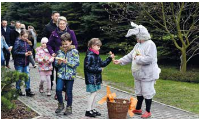
W Gierałtowiec Zajęczek dwoił się i troił...