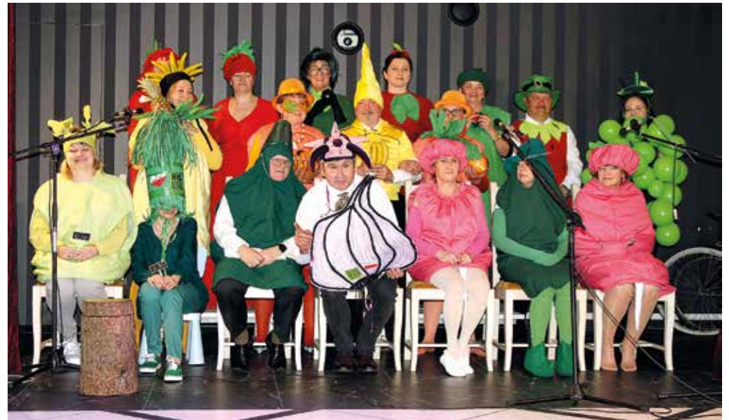
Skecz „Na sztandzie”.