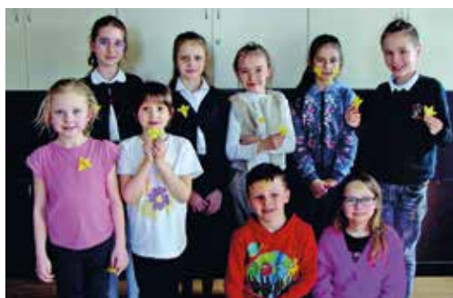
Uczestnicy ze świetlicy w Przyszwowicach.