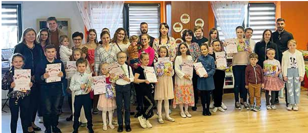
Dzień Talentów pokazał, jak w naszej społeczności jest wiele osób obdarzonych prawdziwą „iskrą Bożą”...