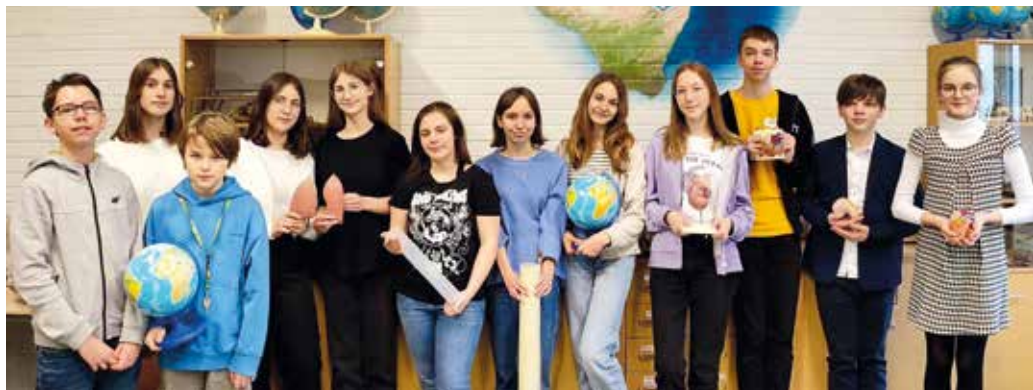
Laureaci i finaliści ze Szkoły Podstawowej w Paniówkach.