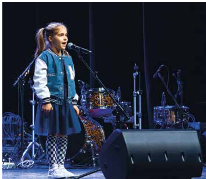
Inka znakomicie czuje się na scenie