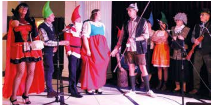
W bajkowym lesie.

Dzień Frelki i Karlusa wspólnymi siłami zorganizowali: Koło Gospodyń Wiejskich i Towarzystwo Przyjaciół Paniówek. jm, fot. J. Miszczyk