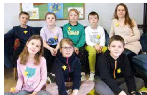
Młodzież ze świetlicy w Chudowie.