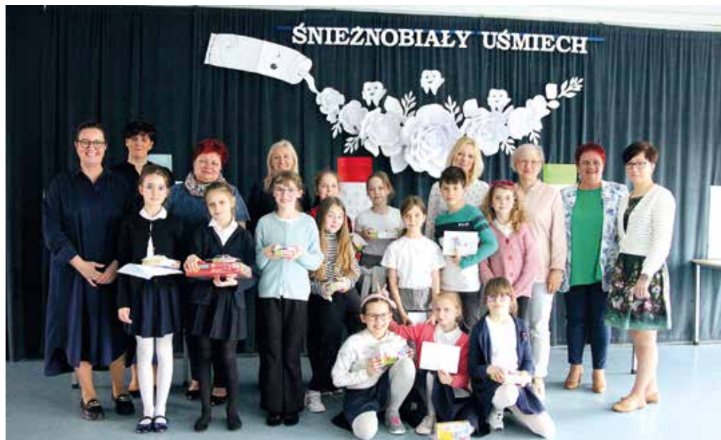
Coroczny konkurs cieszy się zasłużonym prestiżem – aby zakwalifikować się do finału, trzeba być asem...

Po podliczeniu wszystkich punktów, okazało się, że najwięcej zgromadziła ich repre-