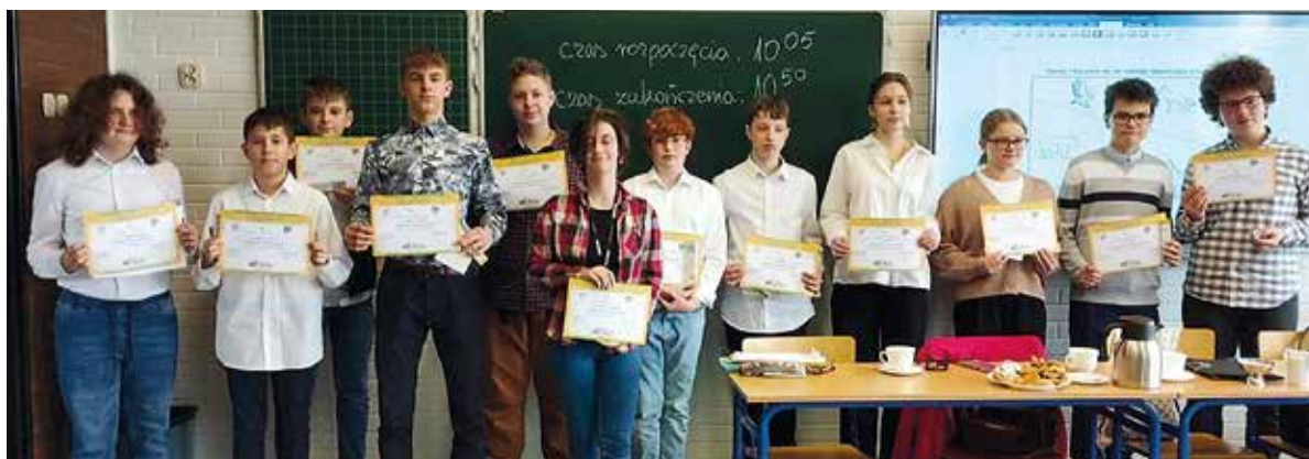
Laureatom konkursu liczby i logiczne zagadki problemu nie sprawiają – a wręcz przeciwnie: dają satysfakcję i motywują...