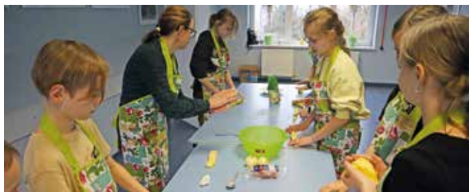
Uczestnikom warsztatów spodobało się kulanie klusek, zresztą ich późniejsze smakowanie również...