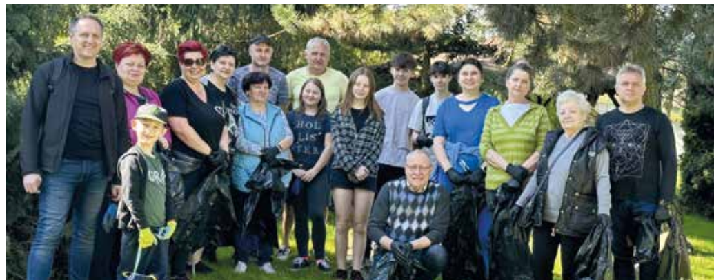
W Gierałtowicach wysprzątane, więc wolontariusze zadowoleni; fot. archiwum Rady Sołectkiej Gierałtowiec.

profil Urzędu Gminy („Gierałtowiec”), zapowiadając stosowną informację. Warto też mieć na uwadze witrynę Zarządu Transportu Metropolitalnego (www.metropoliaztm.pl), gdzie w zakładce „rozkład jazdy” znaleźć można aktualną rozpiskę kursów na wszystkich liniach przewoźnika. /b/