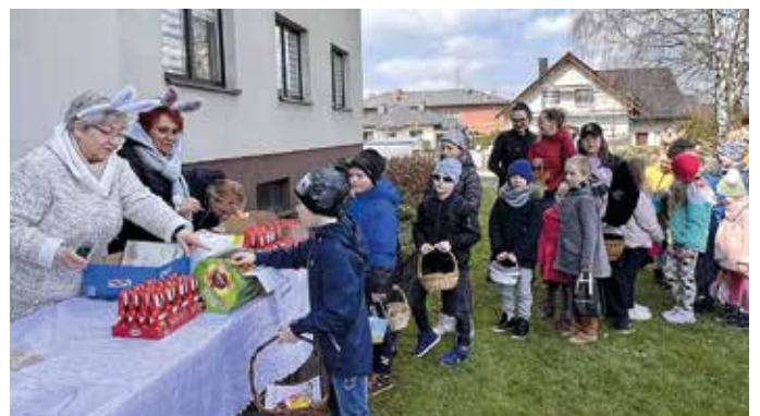
W Chudowie wszyscy zostali obdarowani.

– Mamy nadzieję, że ten zwyczaj na stałe już wpisze się w wielkanocną chudowską tra-