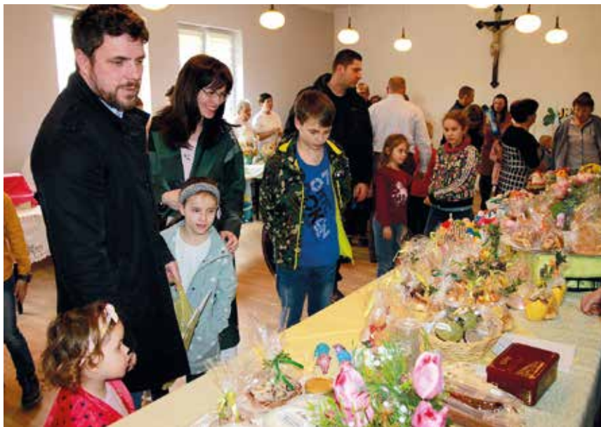
Wypełnione świątecznymi ozdobami stoiska przyciągały wzrok wszystkich gości kiermaszu.

Święta już dawno za nami, warto jednak wrócić do nich i do imprez im towarzyszących, bo cieszyły się wielkim powodzeniem.