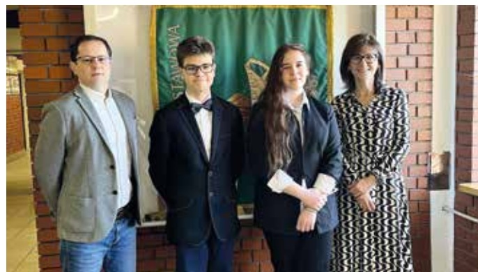
Laureaci i nauczyciele prowadzący ze Szkoły Podstawowej w Przyszowicach.