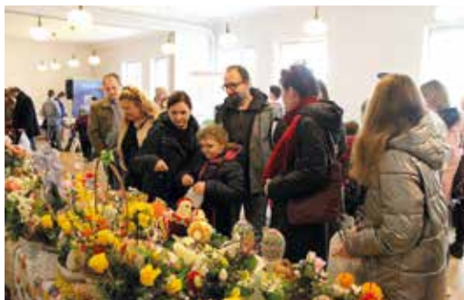
Do zakupu pięknych ozdób zachęcały m.in. panie z Kół Gospodyń Wiejskich