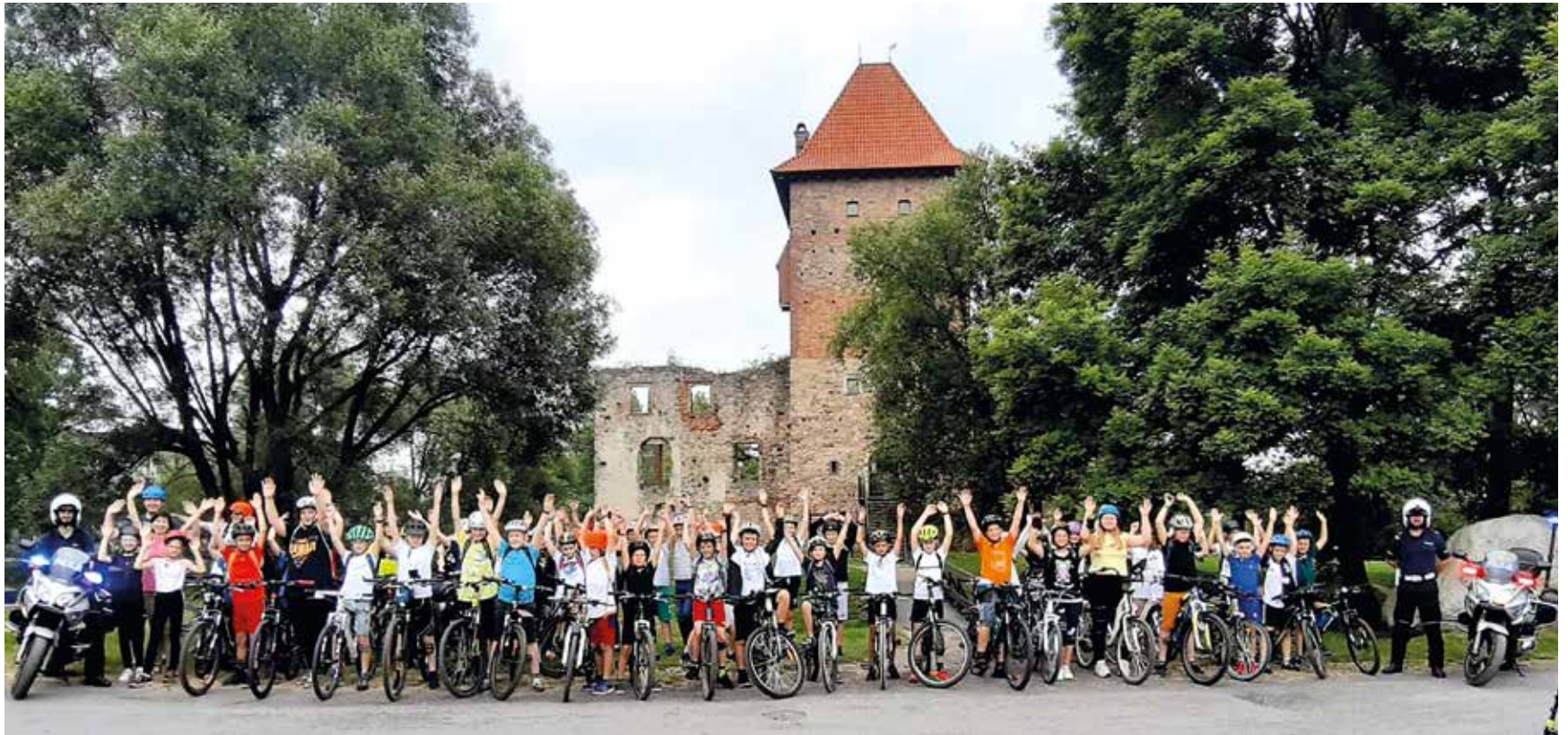
Udany kurs uczestnicy zwieńczyli przejażdżką przed zamek w Chudowie.

jm, źródło: ZSP Gierałtowice foto: arch. SP w Gierałtowicach