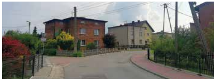
Paniówki, ul. Dworska.