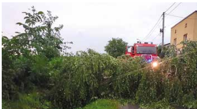
Ul. Zgrzebniołka tarasowało wyrwócone drzewo