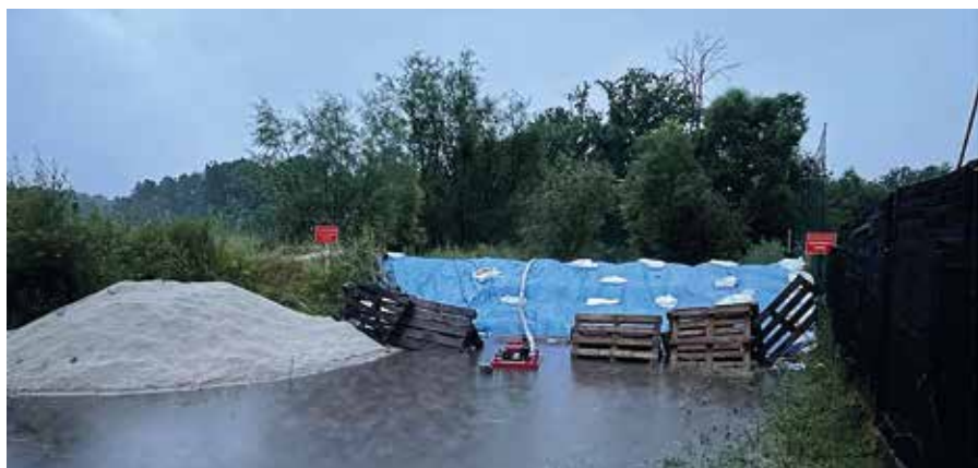
Strażacy zabezpieczyli wał przy ul. Brzeg