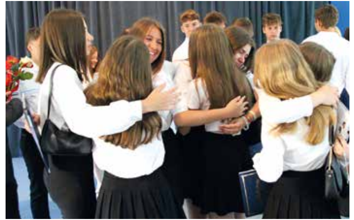
Ostatnie wspólne chwile – absolwenci będą je wspominać z łezką w oku...