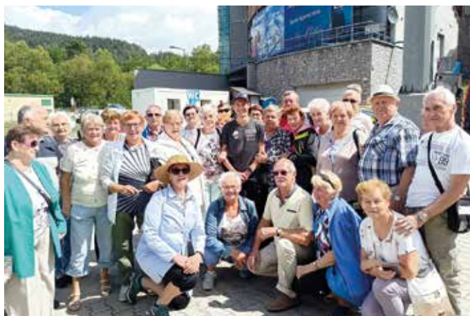
Pamiątkowe zdjęcie w Wisle.