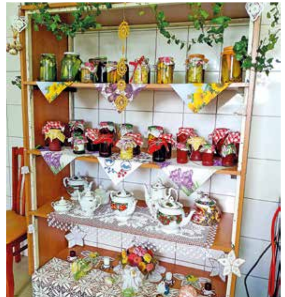
Taki widok to nam w smak – telewizzom też się spodoba...

J. Miszczyk, źródło: A. Czapelka. Foto: arch. KGW w Chudowie