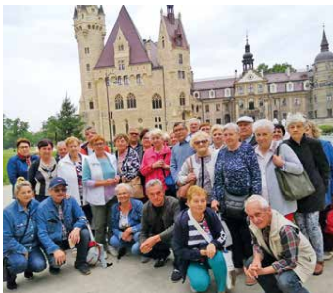
W tle zamek w Mosznej.