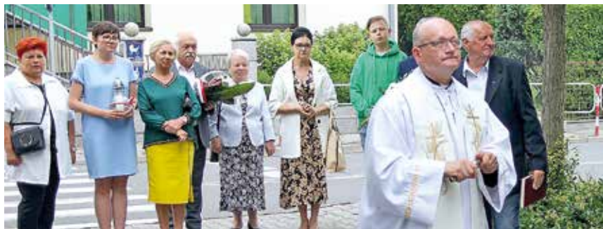
Hołd bohaterom wydarzeń sprzed ponad stulecia oddali przedstawiciele samorządu, instytucji, organizacji społecznych i duchowieństwa; fot. Jerzy Miszczyk

Dzięki funduszom otrzymanym od Instytutu Pamięci Narodowej udało się przeprowadzić renowację pomnika Powstańców Śląskich i Kombatantów Ruchu Oporu w Gierałtowicach.