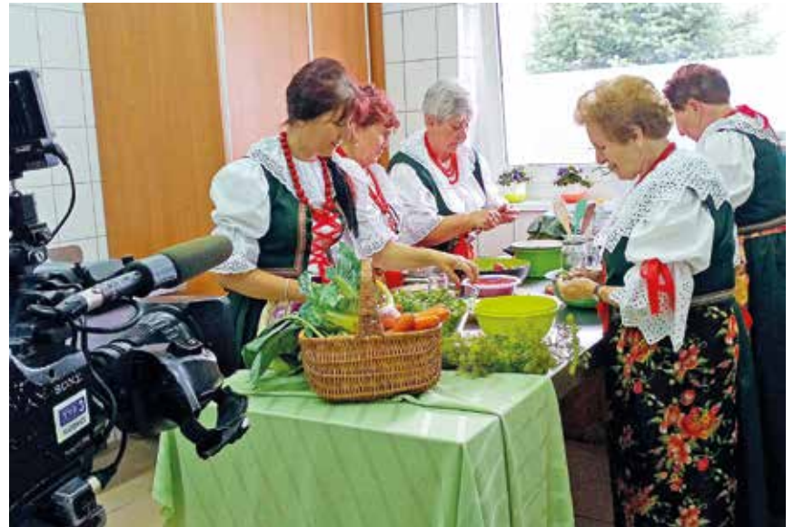
Chudowskie gospodynie znakomicie prezentowały się przed kamerą w tradycyjnych, regionalnych strojach.