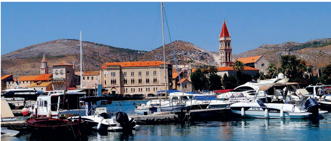
Chorwacja to przepiękny kraj, a uczniowie w Paniówkach umiejętnie to w swoim filmie podkreślili.

Jak się dowiedzieliśmy, nagrodzona praca opisuje historię Chorwacji – od