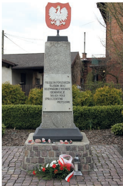
Pomnik w Przyszowicach.