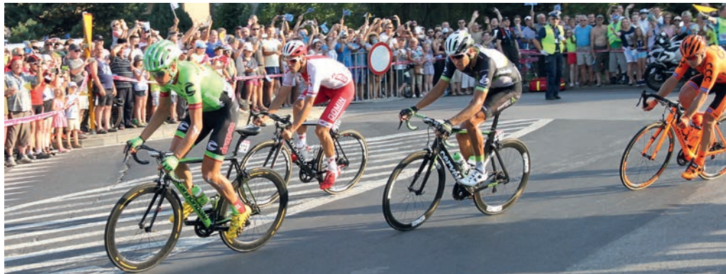
W Tour de Pologne biorą udział kolarze ze światowej czołówki.