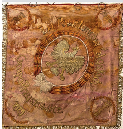
/Bw/ Foto: archiwum Urzędu Gminy Gierałtowice

– 100 lat temu to właśnie ten sztandar towarzyszył przyszowickim powstańcom – informuje Gminna Biblioteka Publiczna w Gierałtowicach. – Obecnie znajduje się on w muzeum im. o. Emila Drobnego w Rybniku.