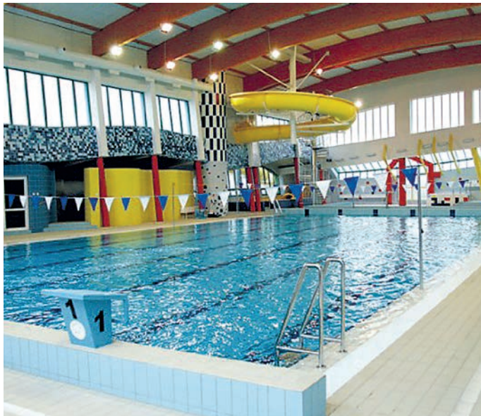
„Wodnik” czeka na amatorów pływania.

Poprawa sytuacji związanej z pandemią umożliwi nie tylko powrót uczniów do szkół, ale i ponowny dostęp turystów i mieszkańców do atrakcji znajdujących się w naszej gminie.