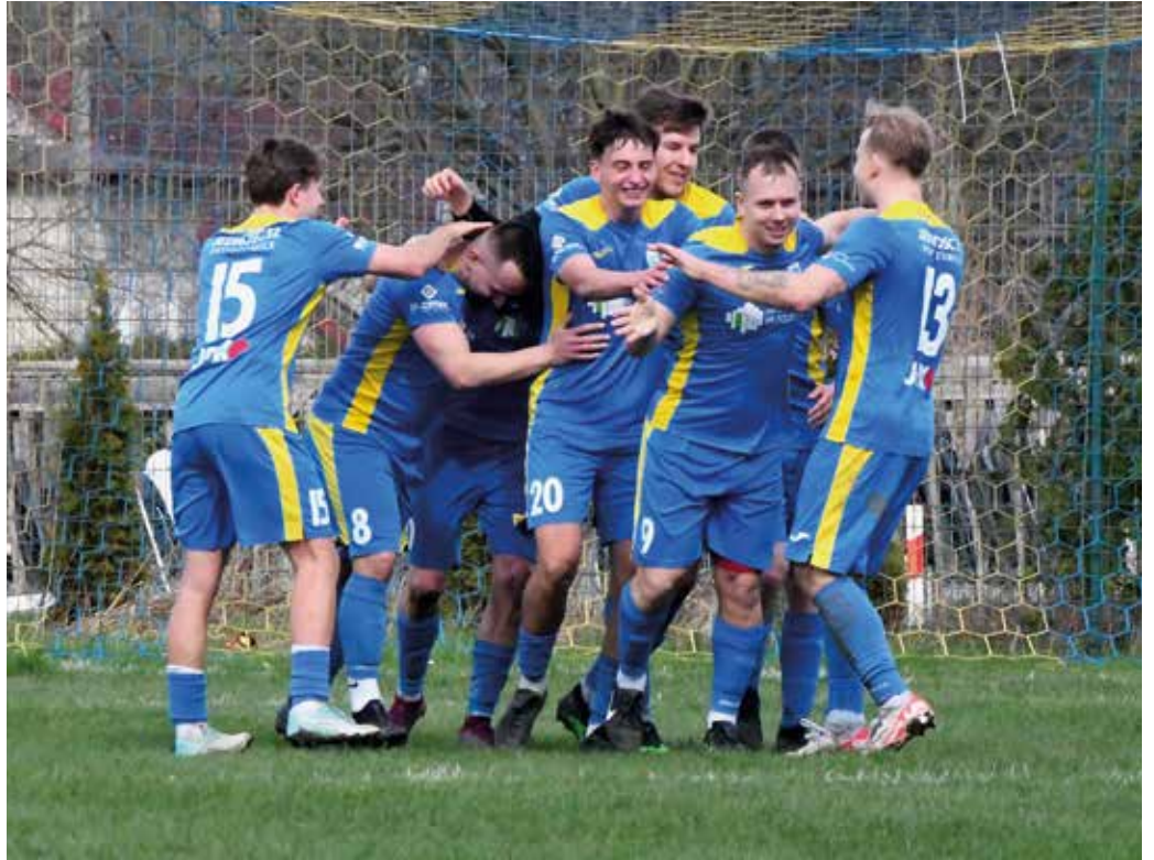
jm. Fot. W.J. Wiosenna wygrana 2:0 nad Concordią sprawiła piłkarzom Jedności sporo satysfakcji.

Informacje z boisk A-klasowych (gr. Zabrze) także podajemy z przyjemnością, gdyż karty rozdaje tam Gwiazda Chudów – bezsprzeczny lider! Pierwszy mecz wiosny Gwiazdy z Rachowicami został przełożony na 24 kwietnia. W drugim, wyjazdowym (16 marca), chudowianie gładko ograli Olimpię Pławniowice 7:0. Trzeci mecz także dał im 3 punkty za zwycięstwo 3:2 z Tęczą Wielowieś. Pomimo zaległego spotkania, Gwiazda pewnie czuje się na tronie lidera z sześciopunktową przewagą nad Gwarciem Zabrze. Po rozegraniu 18. kolejki w klasie okręgowej Tempo zajmuje w niej 4. miejsce z dorobkiem 33 punktów. Tabelki okręgówki i A- klasy opublikujemy w kwietniowym wydaniu.