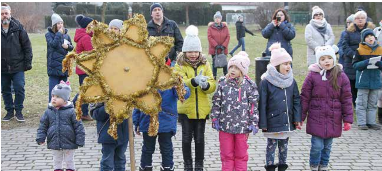
Kolędowanie w Przyszowicach.