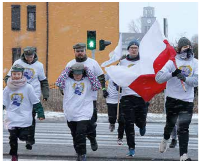
W Biegu Pamięci udział biorą mieszkańcy z różnych stron regionu.