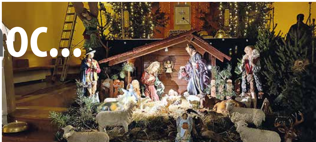
Stajenka w Chudowie.

jm, fot. Jerzy Miszczyk, fot. stajenki w Chudowie: strona fb parafii.