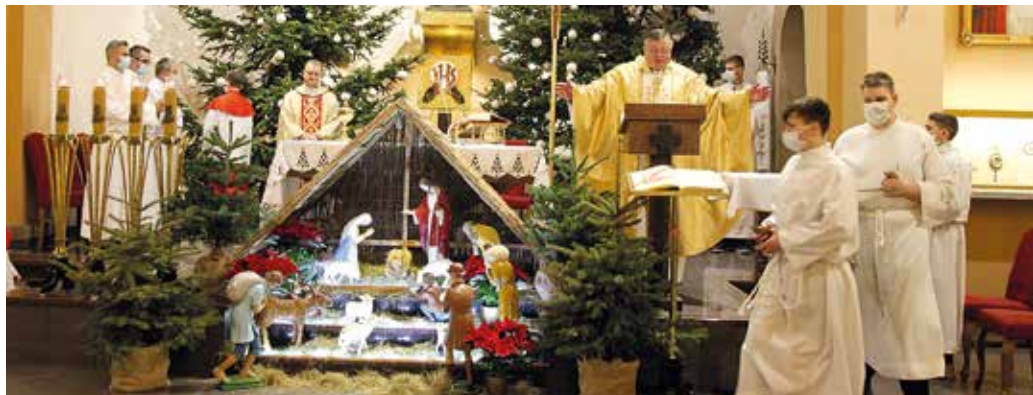
Nabożeństwo pasterskie w Przyszowicach.