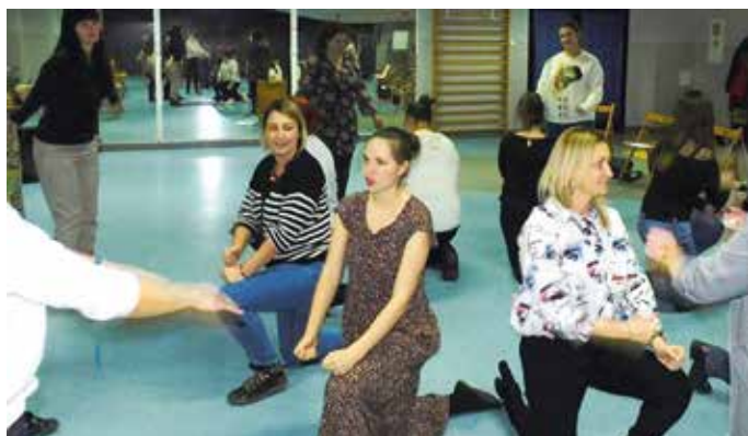
Nauka dawnych tańców okazała się też doskonałą zabawą...