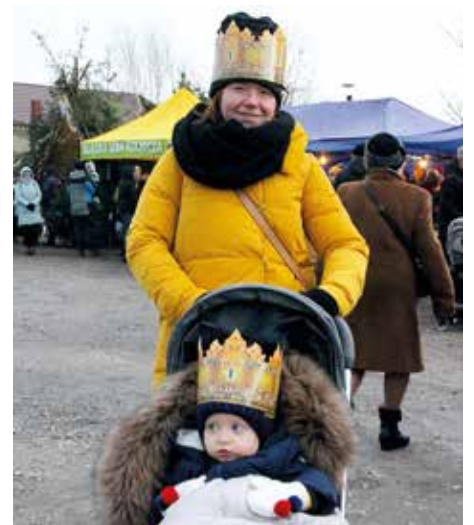
Jak widać, koronowanych głów było znacznie więcej...