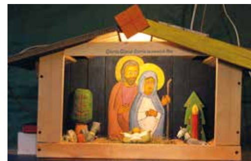
Praca zbiorowa Koła Emerytów i Rencistów.