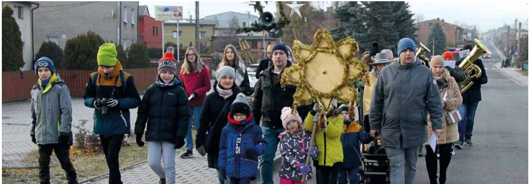
Kolędowanie w Przyszowicach.

PRZYSZOWICE. 77. ROCZNICA MARSZU ŚMIERCI