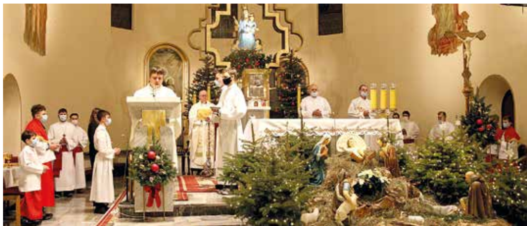
Pasterka w Gierałtowie.