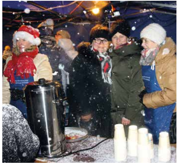
Gorące napoje, serwowane przez gospodynie, pozwalały zwalczyć styczniowy ziąb.