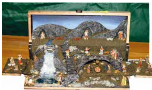
Dzieło Dariusza Gatnera.