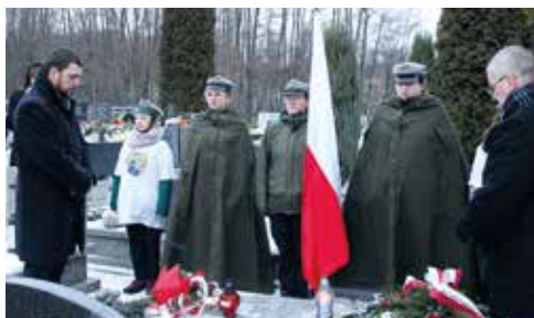
Przyszowice: chwila zadumy nad zbiorową mogiłą pomordowanych przez żołnierzy sowieckich w styczniu 1945 roku.