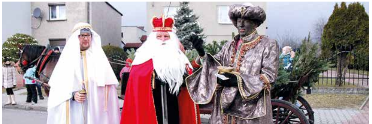
Trzej Królowie w Paniówkach.