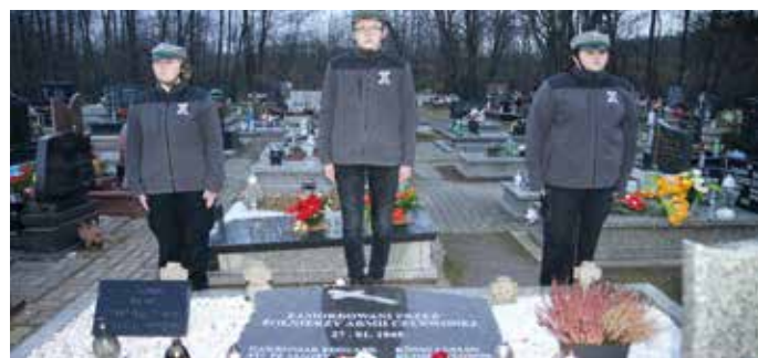
Warta honorowa przed mogiłą ofiar na przyszwickim cmentarzu