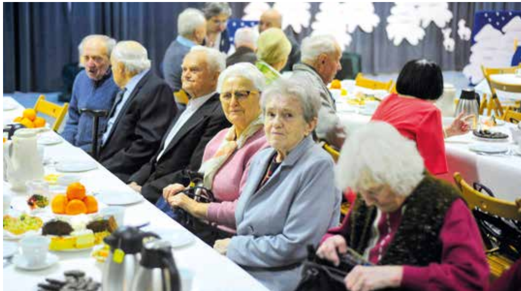
Absolwenci gierałtowskiej szkoły dobrze wspominają spędzone w niej dzieciństwo i młodość.