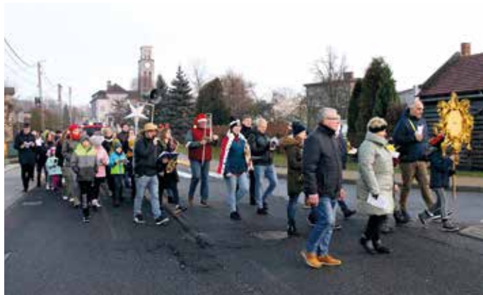
Uliczne kołędowanie spodobało się jego uczestnikom i słuchaczom.

Pod remizą czekały już wesoło trzaskające iskrami ognisko i go-