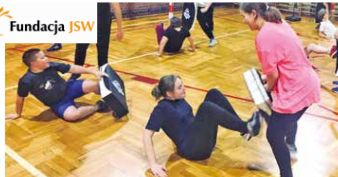
Uczestnicy kursu przykładali się do ćwiczeń.

łożyciel klubu sportowego Fight Club Knurów oraz wychowawca utalentowanej młodzieży, która z powodzeniem rywalizuje w sportach walki na arenie krajowej i międzynarodowej.