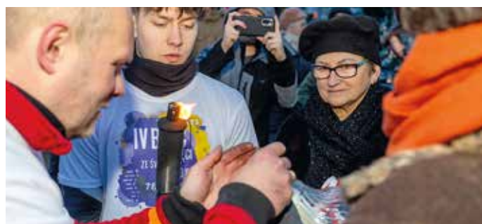
Uczestnicy sztafety dzielili się światełkiem pokoju / fot. Krzysztof Krzemiński.