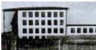
Szkoła – dziewięćdziesięciolatka.

P oprzedni budynek szkolny (teraz mieści się w nim Urząd Gminy), wzniesiony w roku 1879, okazał się zbyt mały na oświatowe potrzeby rozwijających się Gierałtovic. W latach trzydziestych XX wieku do szkoły uczęszczało ponad 400 uczniów. Wzniesienie nowego gmachu okazało się niezbędne.