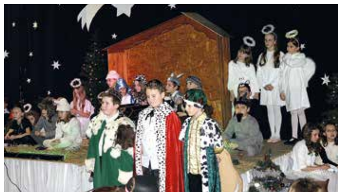
Aniołki i monarchowie – nikogo nie zabrakło...