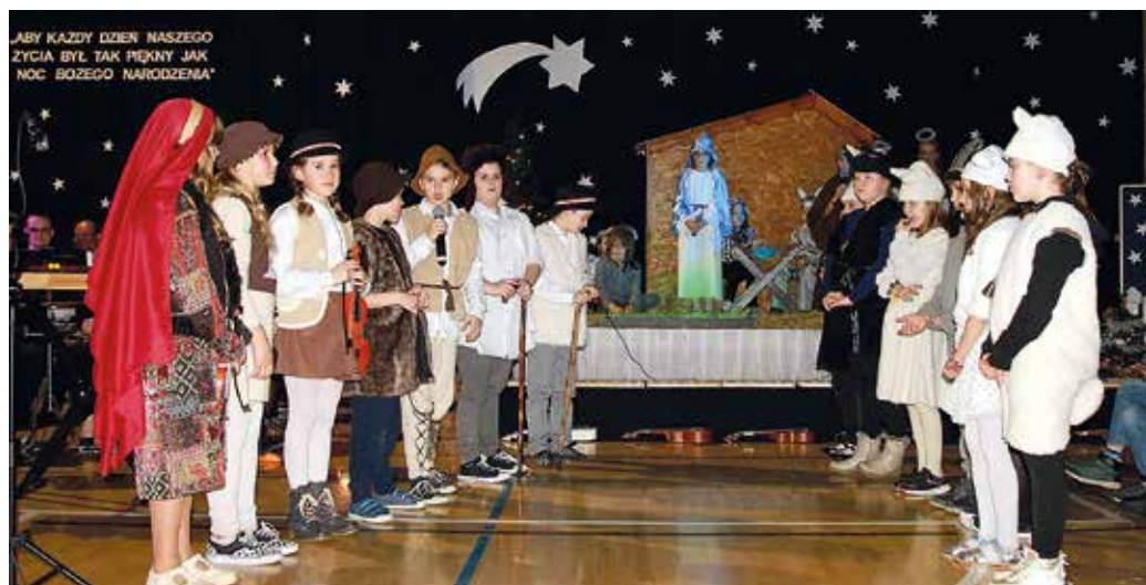
Uczniowie z przejęciem wczuli się w odgrywane przez siebie role.