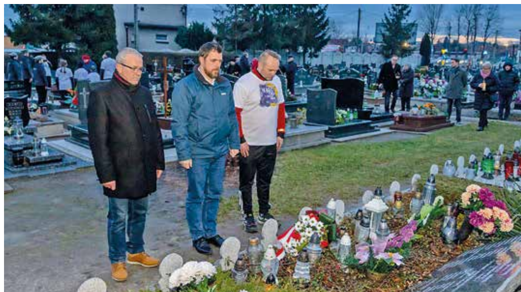
Uczestnicy uroczystości złożyli hołd ofiarom tragicznych wydarzeń sprzed 78 lat / fot. Krzysztof Krzemiński.

– To wydarzenie nie jest organizowane przeciw komukol-