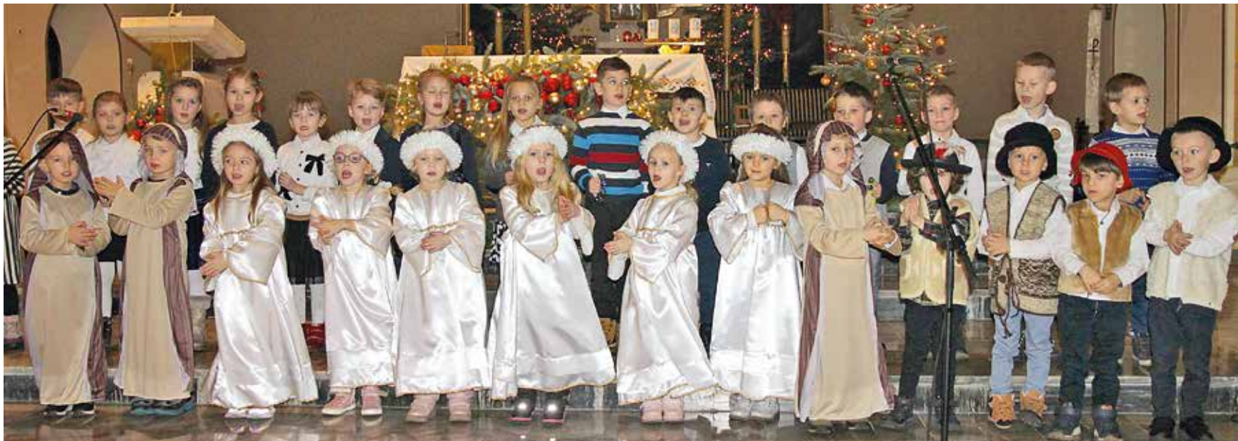
Przedszkolaki znakomicie wczuły się w odgrywane przez siebie role.