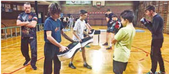
Instruktorzy dokładali starań, by podzielić się z młodzieżą wiedzą i umiejętnościami.

Materiałów niezamówionych redakcja nie zwraca i zastrzega sobie prawo do dokonywania zmian i skrótów w nadsyłanych tekstach. Za treść reklam redakcja nie ponosi odpowiedzialności.