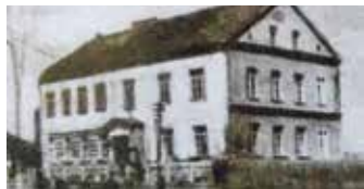
Stara szkoła – dziś siedziba magistratu.

W tym roku przypada 90. rocznica powstania obecnej Szkoły Podstawowej w Gierałtowicach, w miejscu gdzie funkcjonuje do dzisiaj.