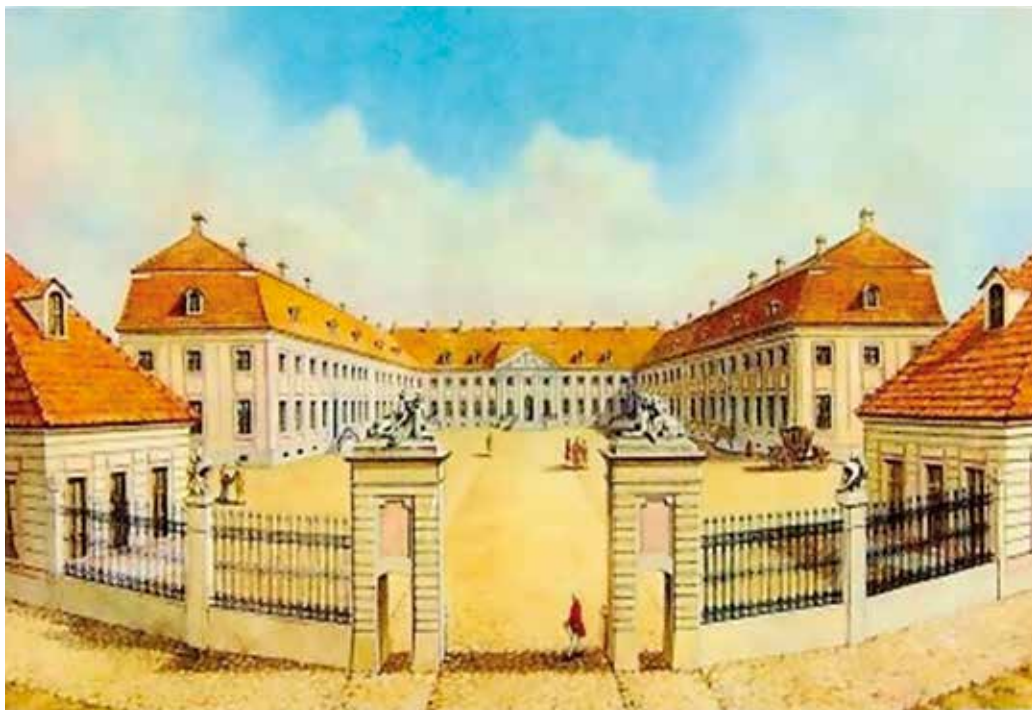
Nowy Zamek w Grodnie, miejsce obrad niestawnego sejmiku rozbiorowego.