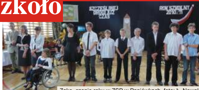
Zakończenie roku w ZSP w Paniówkach

Głównym akcentem uroczystości z okazji zakończenia roku szkolnego w SP im. W. Budryka w Chudowie było poegnanie kolejnego rocznika szóstoklasistów. W tym roku mury szkoły opuściło 16 absolwentów. W akademii zorganizowanej pod hasłem: „To co mam, to radość najpiękniejszych szkolnych lat” udział wzięła cała społeczność chudowskiej szkoły z dyrektorem