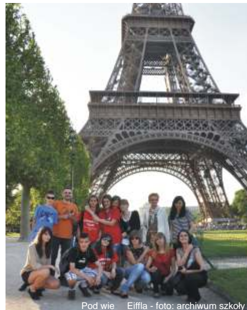
Pod wieżą Eiffli

Wyjazd dostarczył wielu wrażeń zarówno uczniom, jak i nauczycielom. Młodzież nawiązała nowe przyjaźnie, poznała codzienne obowiązki