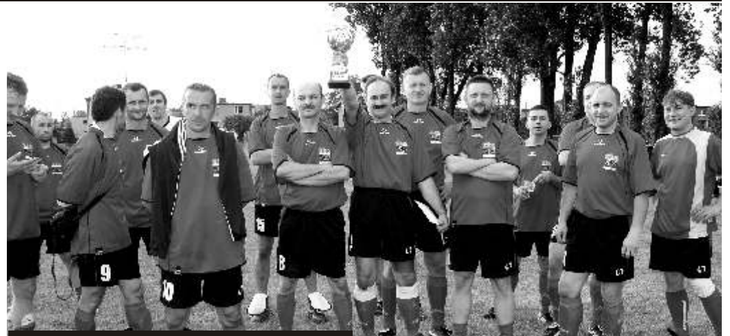
Zwycięska drużyna ZZG Kopalni Makoszowy