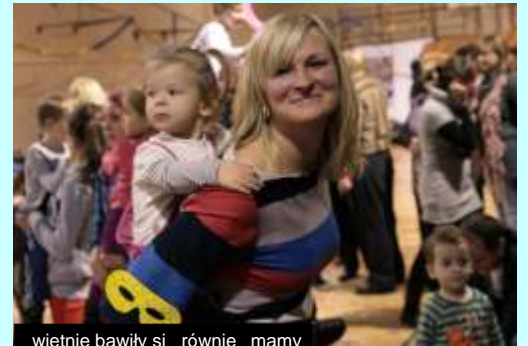
wietnie bawiły się również mamy