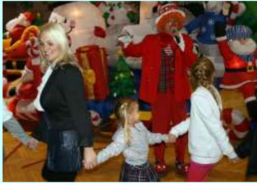
Klauni bawili małych i dużych