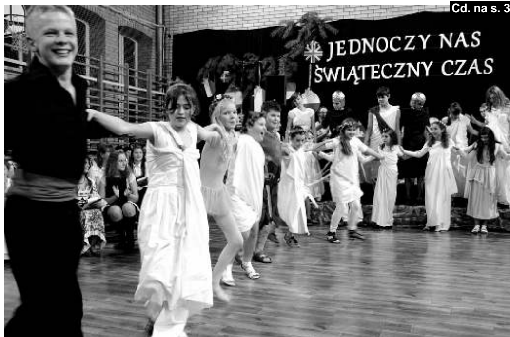
Cd. na s. 3

Po wyczerpaniu programu związanego z uruchomieniem urzędu dnia wigilijnego, dyrektor Wi niewska zaprosiła gości na wypełnione po brzegi sale sportowe, gdzie wspólnie z nauczycielami, uczniami i mieszkańcami Paniówek obejrzała „Europejskie Boże Narodzenie” - →