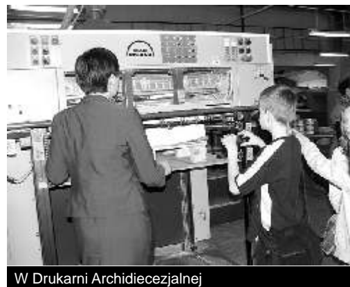
W Drukarni Archidiecezjalnej