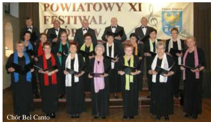
Chór Bel Canto