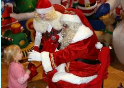
Spotkanie ze w. Mikołajem dla wielu dzieci było olbrzymim przeżyciem