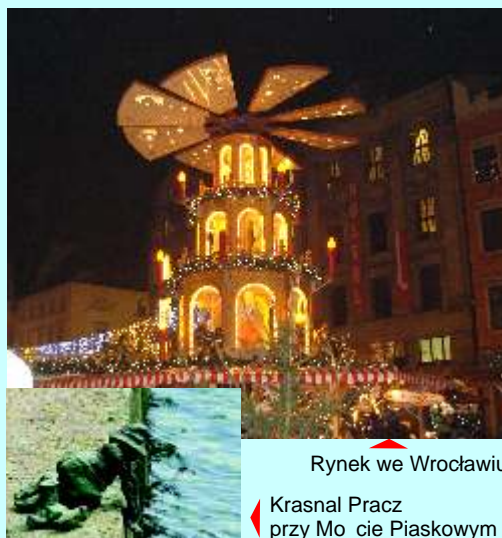
Rynek we Wrocławiu