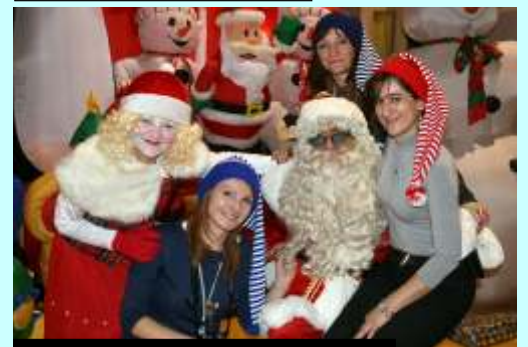
Panie z GOKu pomagały ekipie w. Mikołaja