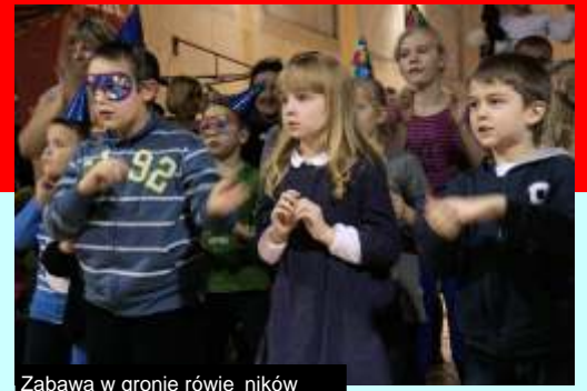
Zabawa w gronie rówieśników