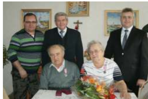
W domu Pa stwa Skubaczów

Wzruszaj cym akcentem spotkania był wy- st p przedszkolaków z Przyszowic. Najmłodszi