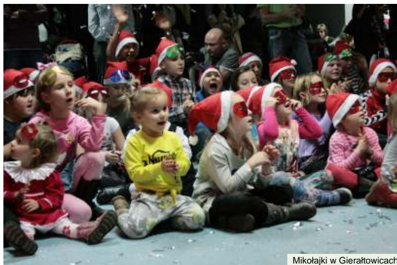
Mikołajki w Gierałtowicach

Gminny Ośrodek Kultury w Gierałtowicach życzy ciepłych i radosnych wianek Bożego Narodzenia oraz samych sukcesów w nadchodzącym roku.