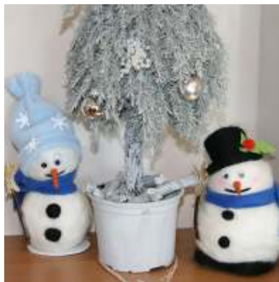
Stoisko GOK na kiermaszu w Przyszowicach