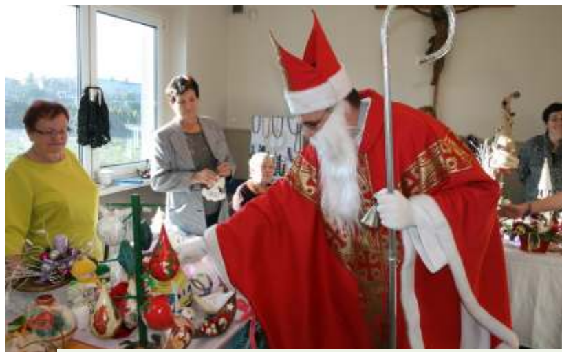
Na kiermaszu w Przyszowicach - św. Mikołaj przy stoisku Państwa z Kół Gospodyń Wiejskich