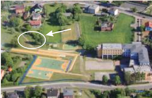
W miejscu zaznaczonym strzałką ma szansę powstać plac zabaw dla dzieci od NIVEA.

Głosowanie trwa do 31 października br. Każda zarejestrowana osoba może oddać 1 głos na 24 godziny!