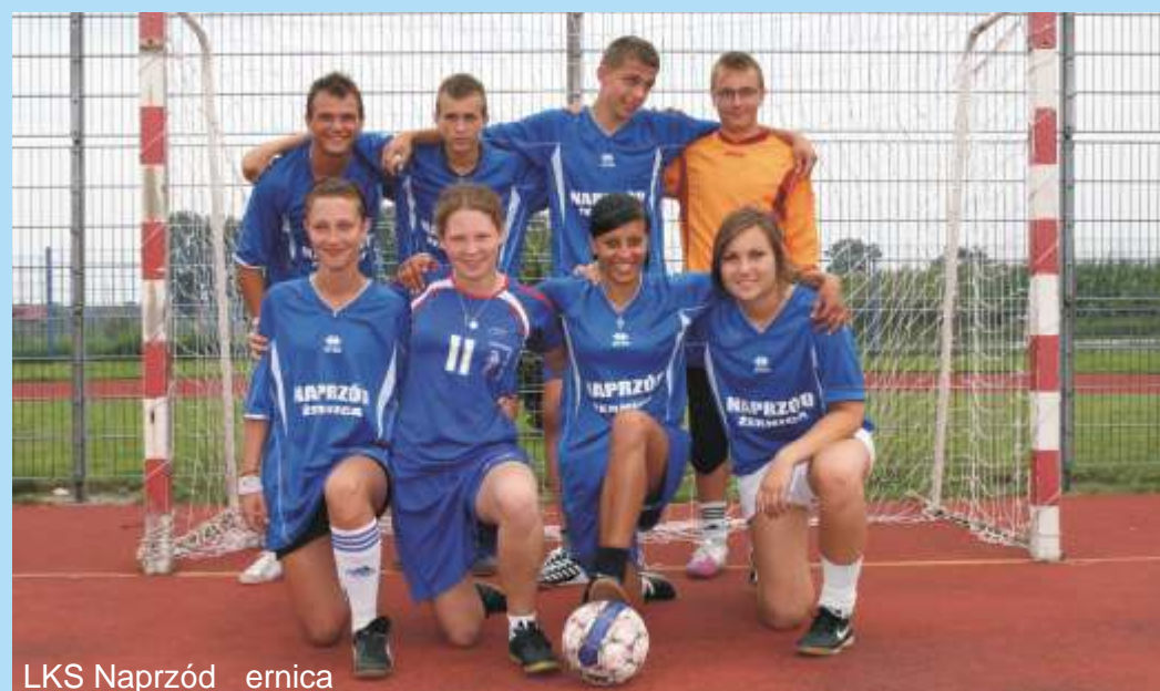
LKS Naprzód ernica

Nauka i doskonalenie pływania dla dzieci i dorosłych