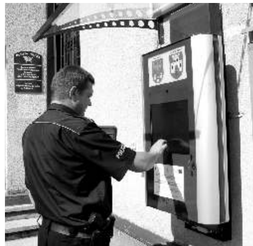
Infokiosk zewnętrzny - przy budynku UG w Gierałtówce

Wszystkie punkty uruchomione zostały w ramach realizacji projektu „PIAP-y dla mieszkańców ziemi gliwickiej”, współfinansowanego przez Unię Europejską z Europejskiego Funduszu Rozwoju Regionalnego w ramach Regionalnego Programu Operacyjnego Województwa łódzkiego na lata 2007-2013. To wspólne przedsięwzięcie Powiatu Gliwickiego (lidera projektu)