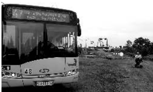
47 czeka na pasażerów zza rzeki

Póki co, przeprawa przez Kłodnicę w tym miejscu możliwa jest tylko dla pieszych, którzy pokonują rzekę po starym moście składanym. Fakt ten wykorzystano WPK i nie zawieszono kursów autobusów przebiegających tą trasą, a m.in. popularnej linii 47 z Zabrze do Szczygłowic. Teraz podróżuje się z przystanku Zabrze-Goethego dojazd do mostu, przejście na drugą stronę rzeki, gdzie po stronie Przyszowic czeka już kolejny autobus linii 47, który zawozi pasażerów do Szczygłowic przez Gierałtówice. Podobnie kurs wygląda w drugą stronę.