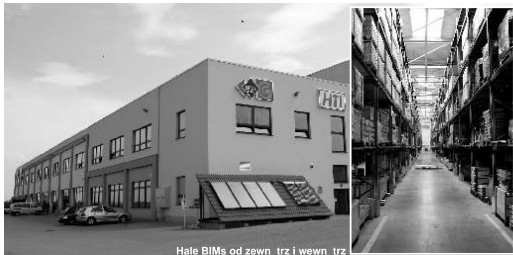
Hale BIMs od zewnątrz i wewnątrz

Pierwsze firmy w parku biznesowo-przemysłowym przy ul. Granicznej (na granicy Gieraltowic i Przyszowic) już rozpoczęły swoją działalność. Od maja br. działają tam najwięksi dotychczasowi inwestor - BIMs PLUS, w lipcu pracę rozpoczęła firma Export Import E.M. Dobrzyński, która do gminy Gieraltowice przeniosła się z Gliwic, a we wrześniu swój nowy zakład otworzy KSB Pompy i Armatura - wiatrowy lider produkcji pomp, armatury i systemów sterowania.