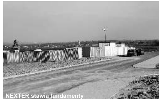
NEXTER stawia fundamenty