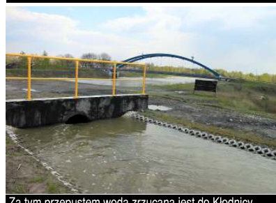
Za tym przepustem woda zrzucana jest do Kłodnicy. Zrobienie wykonano w czasie trwania alarmu przeciwpowodziowego.