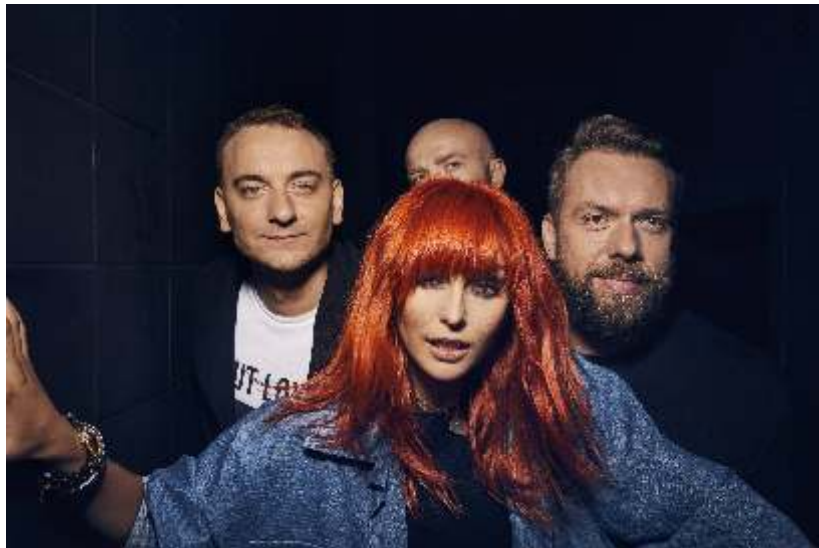
RED LIPS

W bieżącym roku RED LIPS wyrusza w trasę koncertową promując drugi swój album studyjny pt. „Zmiana planu”. Gierałtówice będzie jednym z przystanków na tej trasie. Polecamy słuchanie RED LIPS na żywo i zapraszamy do Gierałtówic!