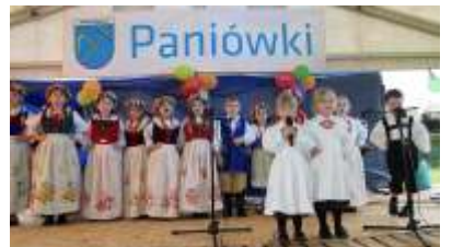
Bajtle z Paniówek - ich występ został przyjęty bardzo ciepło i nagrodzony gromkimi brawami

Festyn tradycyjnie już zorganizowano w Parku Joanny, gdzie w rodzinnej atmosferze bawiło się kilkaset osób. Była okazja do spotkania ze 150 kultur - to za sprawą dzieci tego zespołu Bajtle z Paniówek, który popisał się pięknym wykonaniem wianki oryginalnych, ludzkich pieśni. Innego typu rozrywki dostarczyły uczestnikom uroczystości wesołego miasteczka oraz liczne stoiska gastronomiczne.