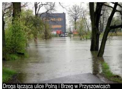
Droga łącząca ulice Polną i Brzeg w Przyszowicach