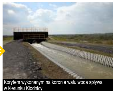
Korytem wykonanym na koronie wału woda spływa w kierunku Kłodnicy

Konieczność pompowania wody na wysokość ponad 20 metrów spowodowana jest faktem, że tereny te leżą w głębokiej depresji względem koryta Kłodnicy. W roku 2010 znalazły się pod wodę, która utrzymywała się tam przez długi okres czasu. Zawiodły wtedy system odwadniania oraz przeciekające wały Kłodnicy. Obecnie wały są wzmocnione, uszczelnione bentonitem i co najważniejsze - nie przeciekają. JM/