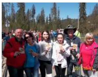
Uczestnicy zlotu w Małym Cichem

Abstynenci swoje doroczne spotkania organizują w miejscach ułatwiających kontakt z przyrodą. W takich okolicznościach o wiele