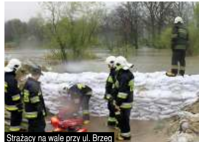
Strażacy na wale przy ul. Brzeg

Długotrwałe opady deszczu spowodowały, iż 28 kwietnia Wójt Gminy Gierałtówice ogłosił pogotowie przeciwpowodziowe, w związku z zagrożeniem powodziowym na terenie Przyszowic, Gierałtówic i Paniówek.