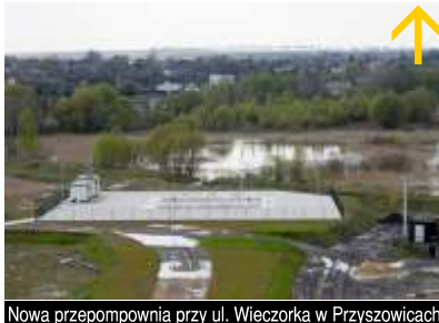
Nowa przepompownia przy ul. Wieczorka w Przyszowicach

system odwadniania uruchomiony pod koniec ubiegłego roku. Jego najważniejszymi elementami są: nowa przepompownia wody przy ul. Wieczorka o wydajności 5,5 tys. m 3 na godzinę oraz potężny wał ziemny na szczycie którego woda jest pompowana, a następnie korytem - wybudowanym na koronie wału - spływa do Kłodnicy. Ta olbrzymia budowla hydrotechniczna wykonana została dzięki staraniom gminy Gierałtówice przez KWK Makoszowy.