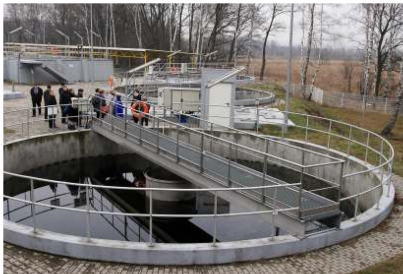
Chętnych do zwiedzania oczyszczalni nie brakowało. Przewodnikami były osoby nadzorujące prace na obiekcie.