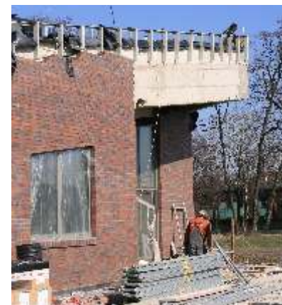
Elewacja ośrodka oraz hol wykładane są cegłą klinkierową.