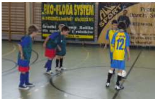
Wyniki meczów i klasyfikacja końcowa turnieju: