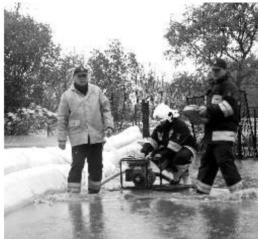
Strażacy z jednostki OSP Przyszowice - przy ul. Brzeg / maj 2010 r. /