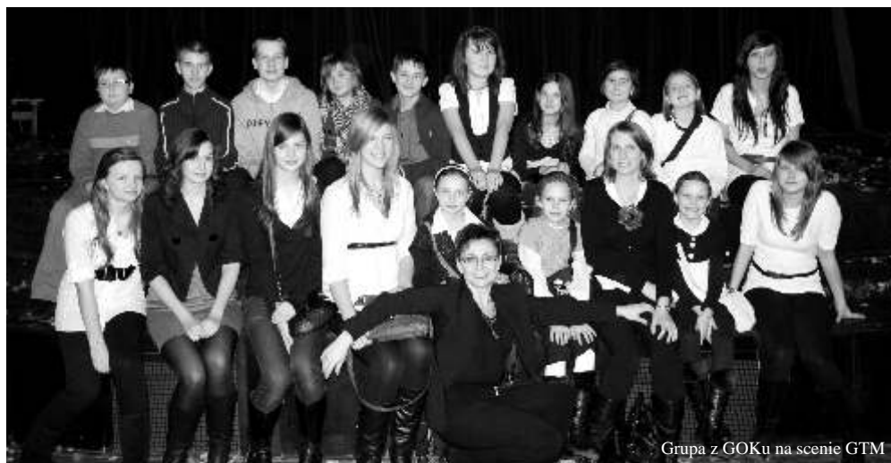
Grupa z GOKu na scenie GTM

miejscowościach, nie tylko spędzenia czasu w sposób atrakcyjny i bezpieczny, ale przede wszystkim pożyteczny. Projekty zgłoszone do konkursu musiały przewidywać zorganizowanie pomocy dla najstarszych i najbardziej potrzebujących mieszkańców (chorych, niepełnosprawnych, samotnych). Mamy nadzieję, że beneficjenci projektów ferii spędzą, dobrze sobie bawiąc