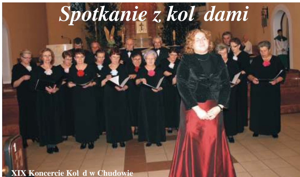
XIX Koncert Kolęd w Chudowie