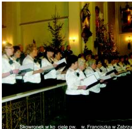
Skowronek w ko cieie pw. w. Franciszka w Zabrzu