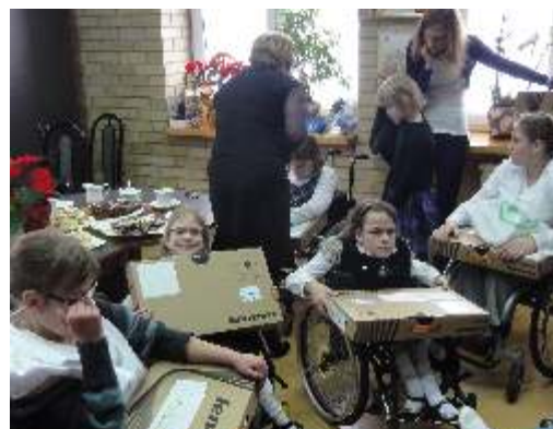
Uczniowie ZSP w Paniówkach z prezentami pod choinkę