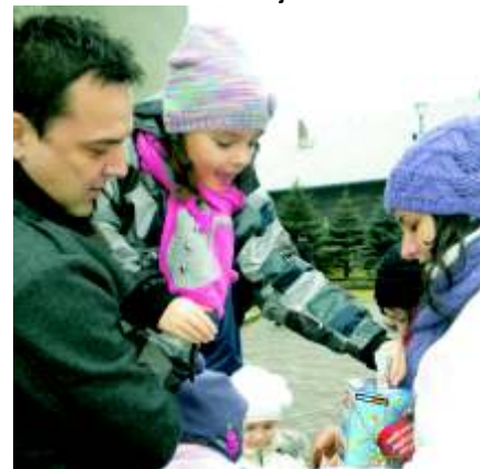
20 Finał WO P w Gierałtówcach