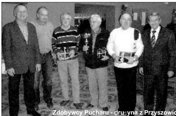
Zdobywcy Pucharu - dru yna z Przyszowic