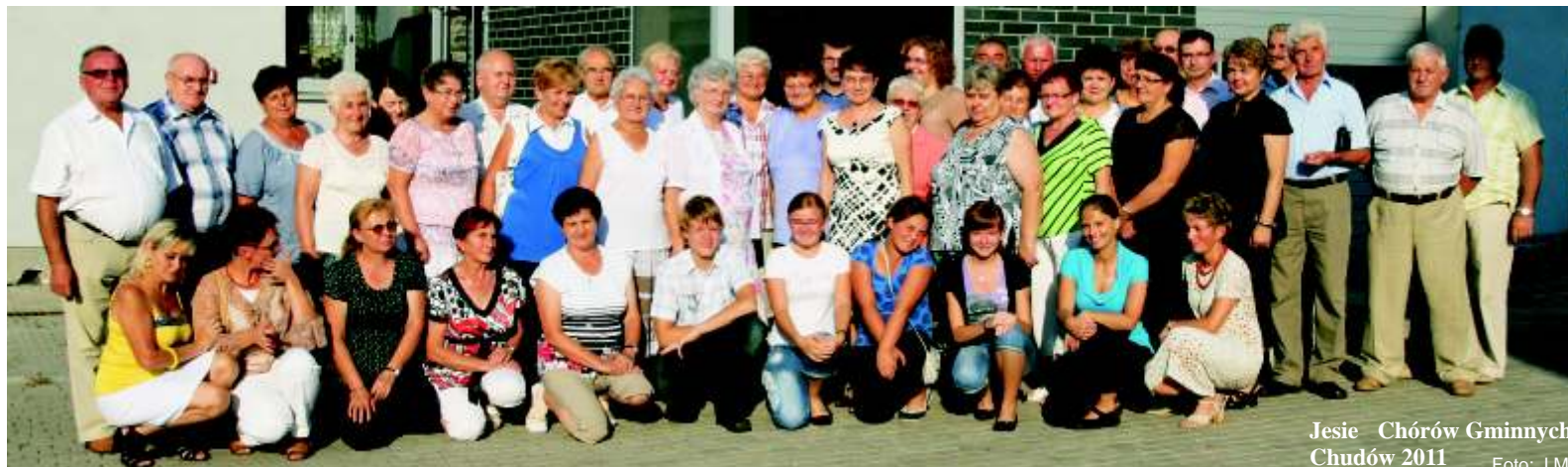
Jesień Chórów Gminnych Chudów 2011

s równie okazją do wspólnej zabawy, rozmów i omawiania muzycznych planów na przyszłość.