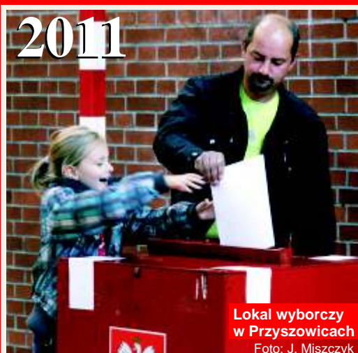
Lokal wyborczy w Przyszowicach

Ponad połowa uprawnionych do głosowania mieszkańców gminy wzięła udział w wyborach parlamentarnych. Frekwencja wyborcza wyniosła 50,14% .