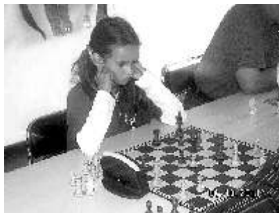
VI Turniej o GP Gminy Gierałtowiec - (pierwsza ósemka)

7 turniej rozegrany zostanie 3 listopada, jak zwykle w sali GOK w Gierałtowiecach.