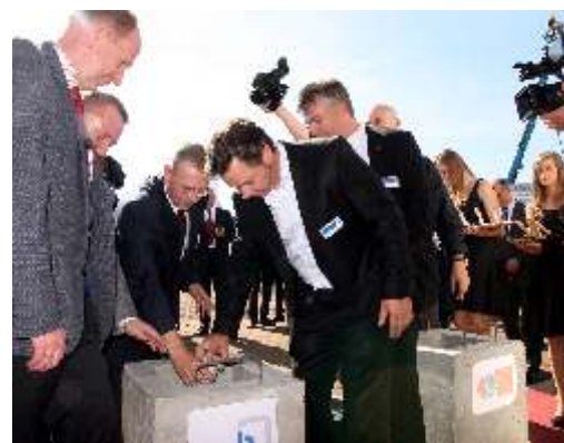
Szefowie i pracownicy firmy KSB wkładają tub z "Aktym Erekcyjnym" do kamienia w gielnego.

Okazale wypadło oficjalnie rozpoczęcie budowy strefy przemysłowej Synergy Parku w gminie Gierałtówice. 28 września kamienie w gielne pod pierwsze inwestycje wmurowali jednocześnie czterech inwestorzy: BIMS PLUS (sieć hurtowni instalacyjnych), Export Import E.M. Dobrzyński (dystrybutor niemieckiej armatury sanitarnej Saint Aisenberg i Abusanitar), KSB Pompy i Armatura (wiatrowy lider produkcji pomp, armatury i systemów sterowania) oraz Hurtownia Farmaceutyczna NEXTER . Dwie pierwsze firmy budują swoje hale już od kilku miesięcy. Kolejne dwie: KSB Pompy oraz NEXTER wkrótce rozpoczną prace budowlane. Firmy te zainwestują tu około 60 mln zł . Docelowo przewiduje się zatrudnienie 2 tys. pracowników.