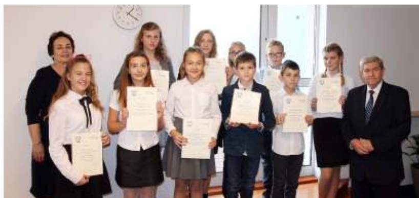
Uczniowie z najmłodszej grupy stypendystów.