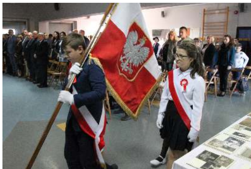
Obecność Pocztu Sztandarowego ZSP Gierałtowice, podkreślała uroczysty charakter wydarzenia.

Otwarcie wystawy odbyło się 7 listopada w auli gierałtowskijskiej szkoły i połączone było z uroczystą akademią. W wydarzeniu uczestniczyli przedsta-