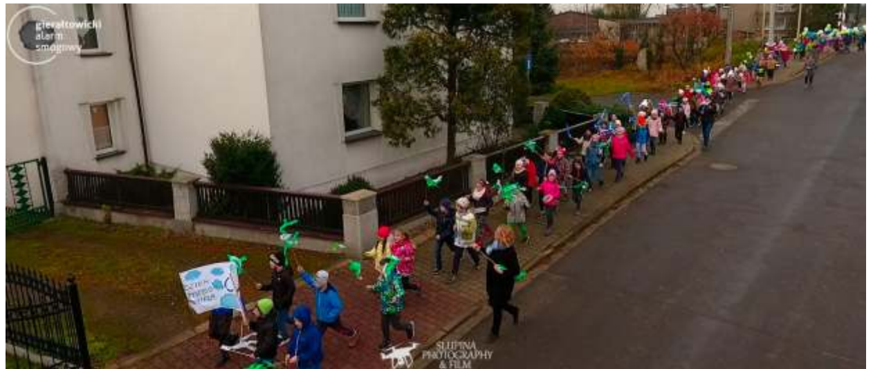
Pochód dzieci w Przyszowicach

We wszystkich szkołach gminy, w grupach wiekowych 4-8 lat, przeprowadzono lekcje edukacyjne na temat smogu. W najbliższym czasie podobne lekcje zostaną przeprowadzone dla dzieci w grupach wiekowych 9-13 i dla młodzieży w wieku 14+. Łącznie programem edukacyjnym zostanie objętych ponad 1000 dzieci we wszystkich sołectwach naszej gminy.