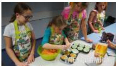
Małe babeczki, a jaka duża frajda...

Piekarnik nagrzać do 180 stopni, kratkę metalową umieścić w jego środkowej części. Marchew obrać i zetrzeć na tarce o grubych oczkach, odmierzyć 2 szklanki. Do miski przesiać mąkę