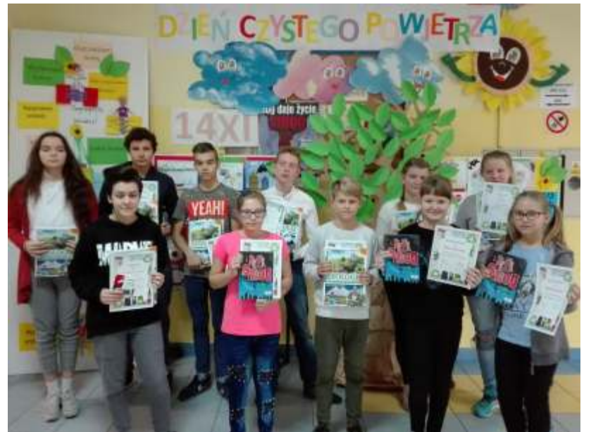
Dzień Czystego Powietrza w ZSP w Gierałtowie