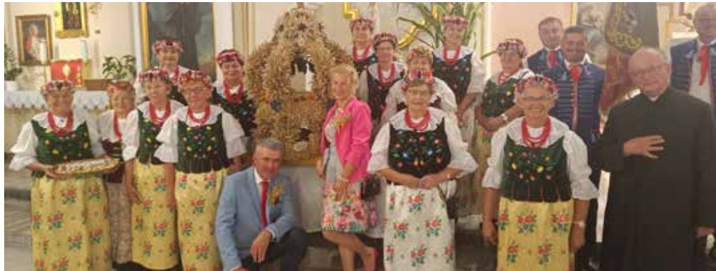
Gierałtowiec – dziękczynnie za plony, fot. archiwum KGW Gierałtowiec.