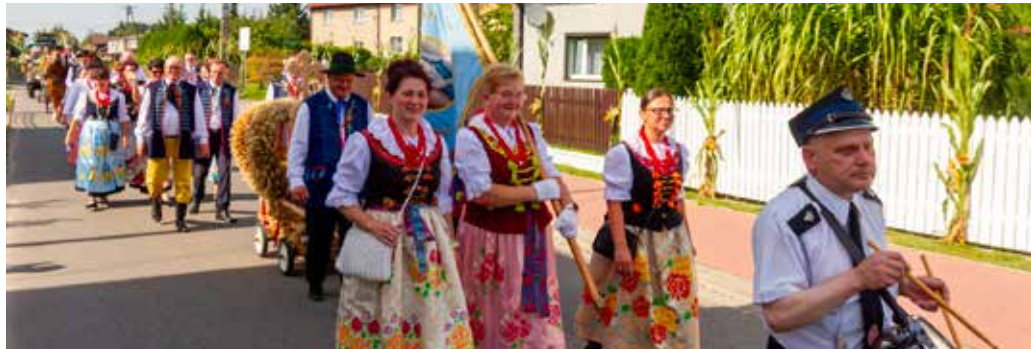
Paniówki w barwnym korowodzie, fot. Krzysztof Krzemiński.