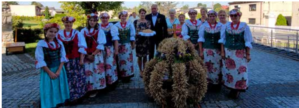
Przyszwice – żniwne AD 2023, fot. archiwum KGW Przyszowice.