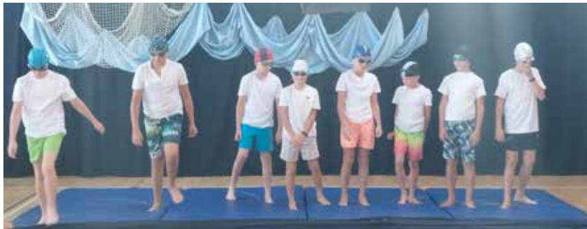
Paniówki: w nowy rok szkolny wprowadzili uczestników inauguracji humorystycznym programem artystycznym uczniowie klasy 5a, fot. archiwum szkoły.