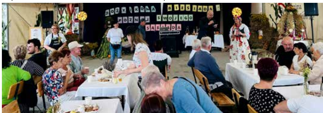
Chudów – biesiadna integracja