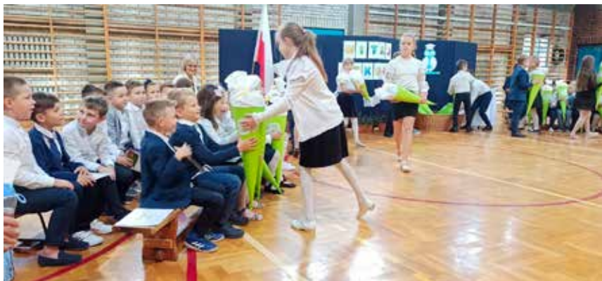
Przyszowice: pasowanie zaliczone, teraz czas na tyty...