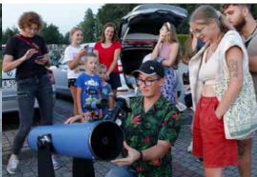
Księżyc okazał się bardzo wdzięcznym obiektem do kosmicznej obserwacji, fot. Jerzy Miszczyk.