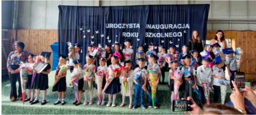
Chudów: kolejny rocznik pierwszaków rozpoczął edukację, fot. archiwum szkoły.

Najwięcej, bo 60, pierwszoklasistów uczęszcza do Szkoły Podstawowej w Gierałtowicach. – Do klas pierwszych w szkole w Paniówkach chodzi 55 uczniów, w Przyszowicach – 40, a w Chudowie – 28. W sumie utworzono dla nich 10 oddziałów szkolnych – doprecyzowują pracownicy gminnej oświaty. /jm/